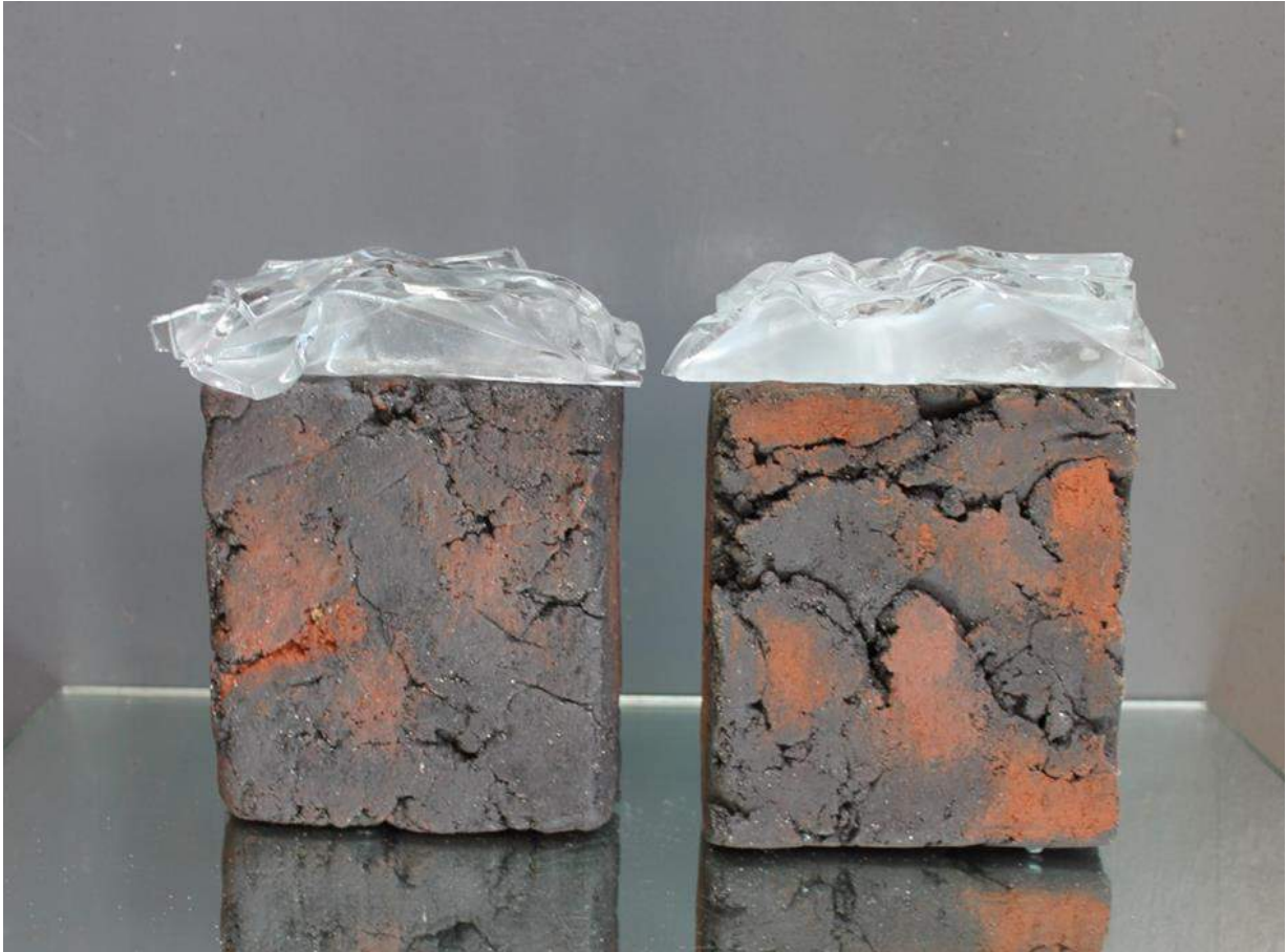
Marie-Pierre Majourau, Sans titre , grés et verre, (25x25) x 2 cm, 2020