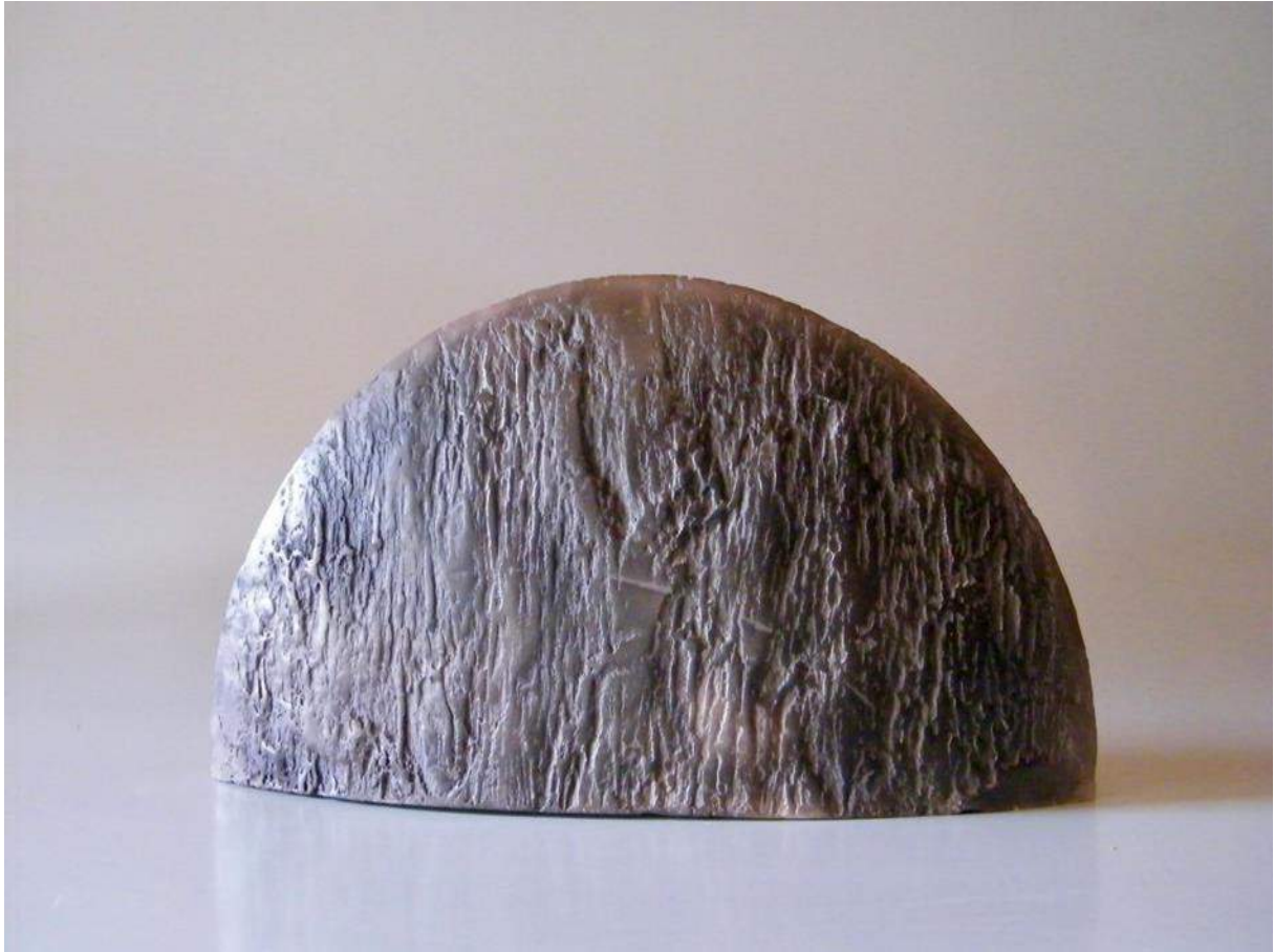
Jean-François Delorme, Ko lin , céramique enfumée, 45cm environ à la base