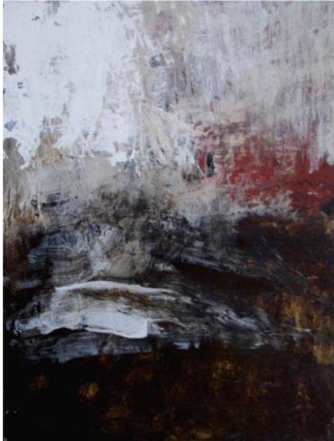
Paul Le Rabo , Ombre au couchant , acrylique sur toile, 117 x 90 cm, 2020