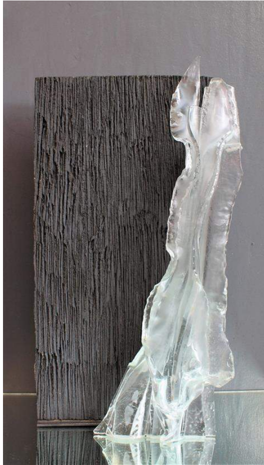
Marie-Pierre Majourau, Sans titre , grés et verre, 60 x 30 cm, 2020