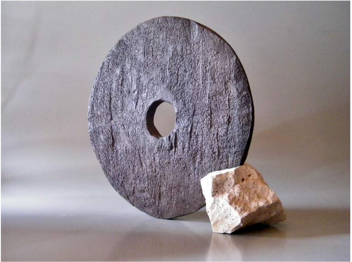
Jean-François Delorme, BI 6 , céramique enfumée et pierre, 50cm environ.