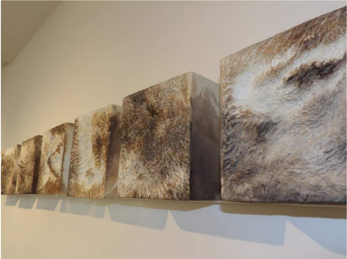
Marie-Pierre Campistro, Série "Empreintes", grès blanc enfumé- support bois, panneaux muraux, 195 cm X 20 cm