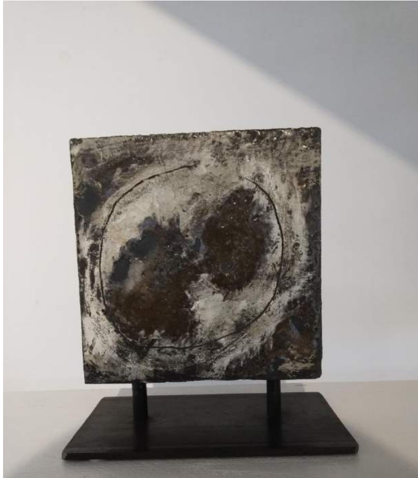
Marie-Pierre Campistro, Série « Origine », grès noir mono-cuisson au bois haute température, 50 x 50 cm