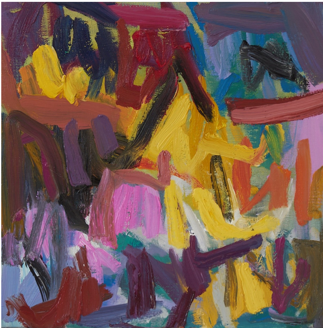
Oaia Peruarena, Sans titre, 40 x 40 cm, huile sur toile, 2020