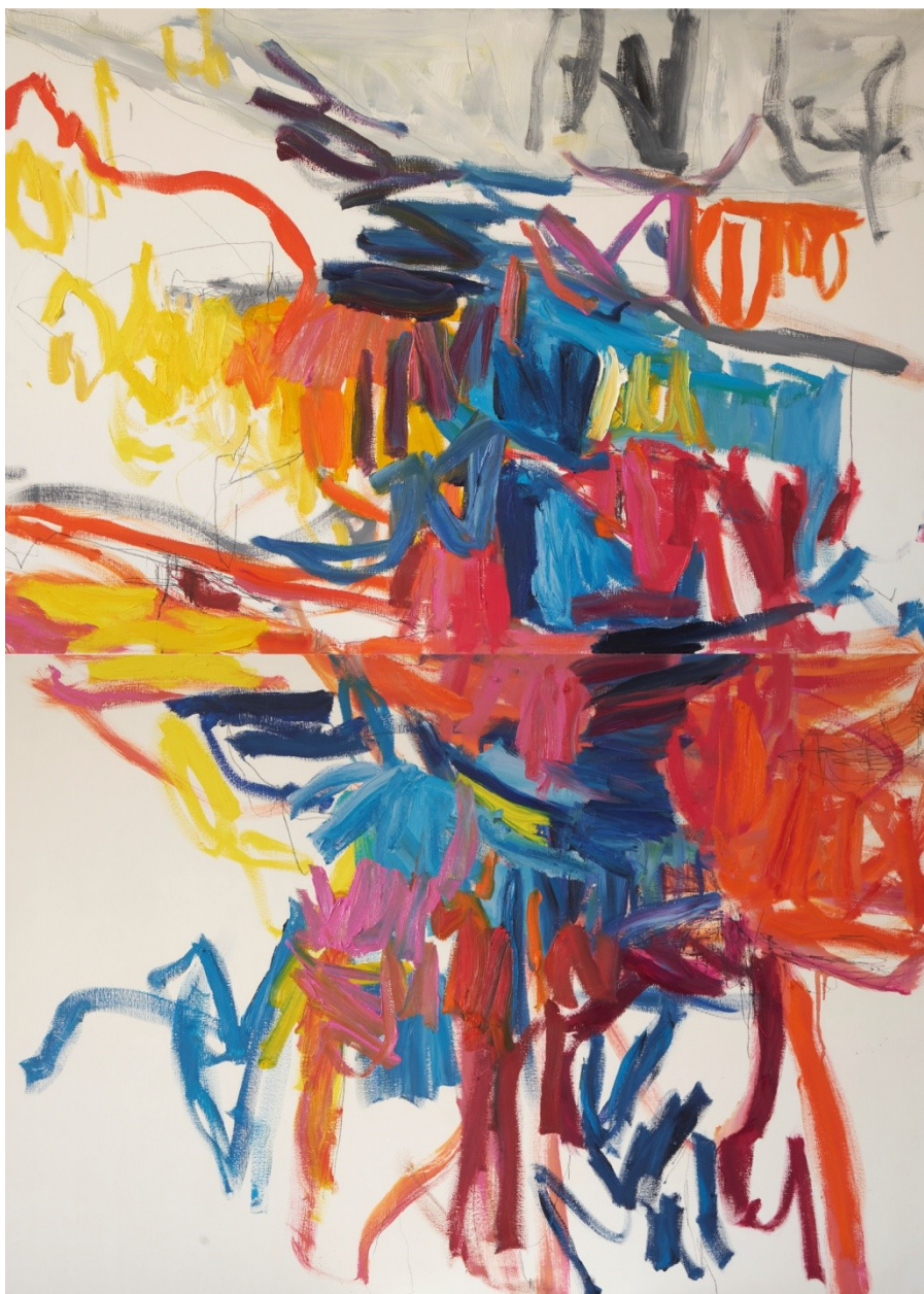
Oaia Peruarena, Sans titre, 116 x 162 cm, huile sur toile, 2020