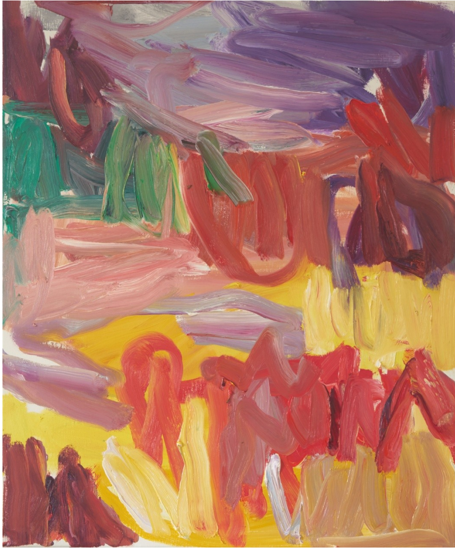
Oaia Peruarena, Sans titre, 54 x 65 cm, huile sur toile, 2020